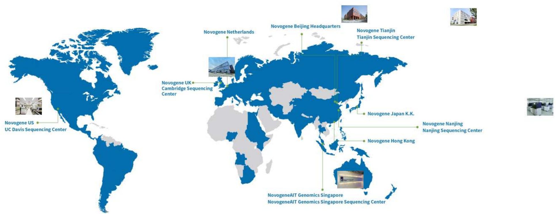
| Areas where Novogene provides service